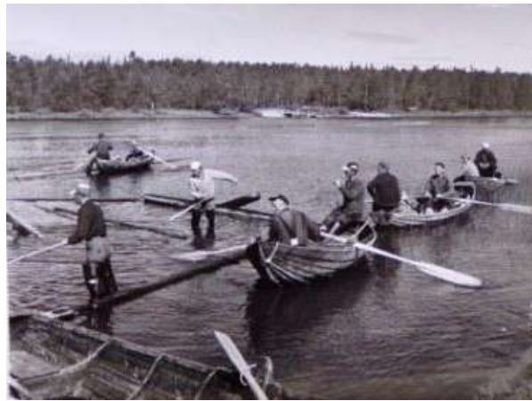
Hällby— Åseleälven. Flottargänget på väg ner mot Gammboforsen och Edan. På bilden går "Rompan" förbi färjeläget i Hälla. Mot nordväst. Foto: A.L juli 1959.

Nicklas Orädd har från Vattenfalls arkiv räddat en samling av gamla bilder från Hällaforsen och Hällby kraftverks tillkomst.